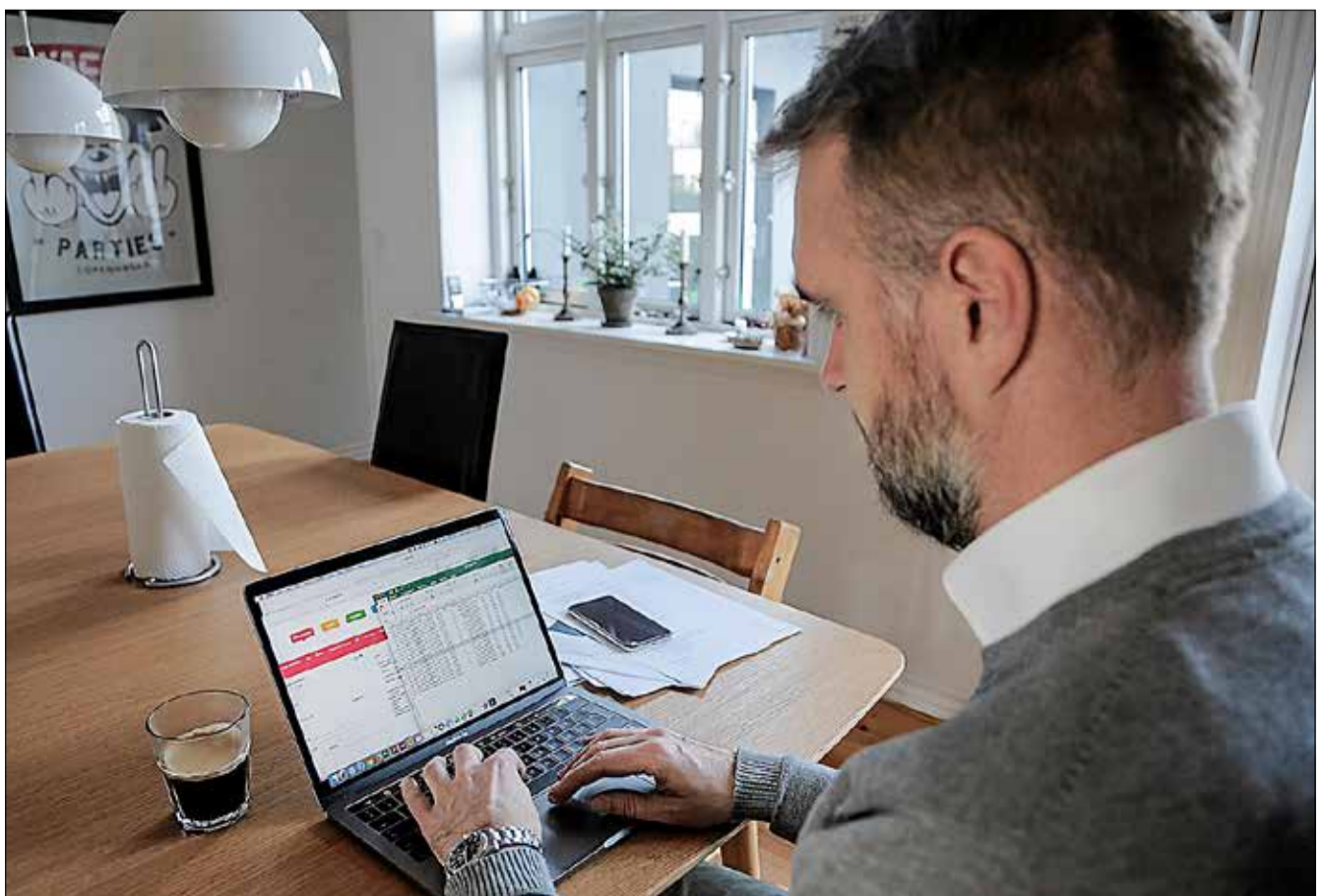
De 2500, som har en profil hos Cleady, kan bookes til rengøringsopgaver hos private i deres valgte nærområde.

» Vi bruger det stadig i vores PR (deltagelsen i »Løvens Hule«, red.), og nye deltagere kan altid ringe til mig for at høre om vores erfaringer.